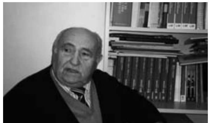
VLL. Llopiz, responsable de la comisión de Mayores de la FRAVM.

V.L.LL.: La última palabra no está dicha. Si nos esforzamos podemos conseguir que una movilización sostenida obligue al Gobierno a rectificar. Por eso, es importante concienciar a todos los pensionistas en la idea de que el derecho a cobrar nuestra