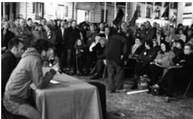
Pleno ciudadano alternativo celebrado en la plaza de la Villa el 11 de noviembre.

"Estas convocatorias -subraya Murgui-, constituyen los primeros pasos para la puesta en práctica de un modelo de participación ciudadana alternativo al actualmente vigente, que se ha demostrado obsoleto y manifiestamente ineficaz".