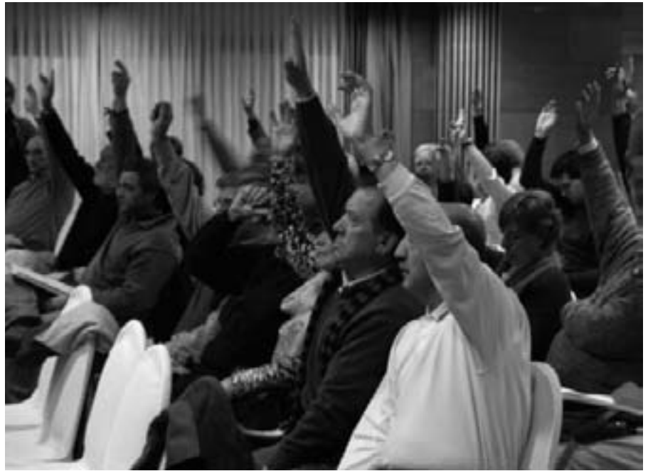
Asamblea de la FRAVM celebrada el 13 de diciembre de 2007.

Las 271 asociaciones que conforman la FRAVM tienen una cita el próximo 27 de enero para evaluar la labor realizada los tres últimos años y elegir junta directiva. El nuevo equipo tiene por delante un mandato indefectiblemente marcado por la crisis económica y las consecuencias de la reaccionaria respuesta de unas administraciones públicas empleadas a fondo en seguir las directrices de los gurús del poder financiero a costa de los derechos de ciudadanía.