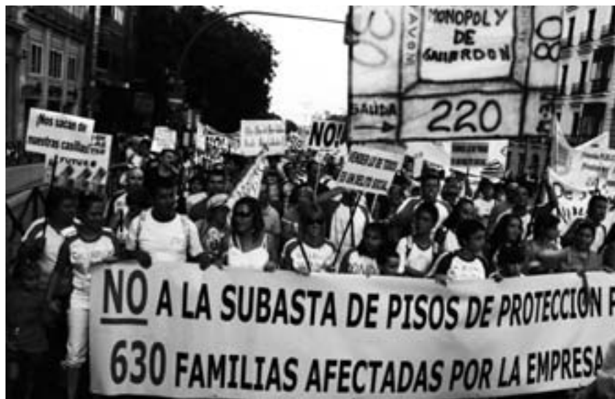
El 5 de septiembre, unas 3.000 personas se manifestaron por el centro de Madrid contra la subasta del Ayuntamiento.

Por el momento, estas intenciones han calmado a las familias, que desde que el pasado 31 de julio el Ayuntamiento anunció sus propósitos, no han cesado de movilizarse para reclamar la permanencia en sus casas con las mismas condiciones en las que entraron. En poco más de un mes y en pleno verano, organizaron siete protestas en la calle, la última de las cuales, celebrada el 5 de septiembre, reunió en una manifestación a más de 3.000 personas. Tras la subasta y ante las promesas de la promotora, el movimiento ha ido perdiendo fuelle, lo que no quita para que de él naciese una nueva entidad que hoy está federada en la FRAVM, la Asociación de Vecinos Afectados por la EMVS (AVASEMVS), que sigue reclamando el derecho de los inquilinos de estas promociones a adquirir sus viviendas.