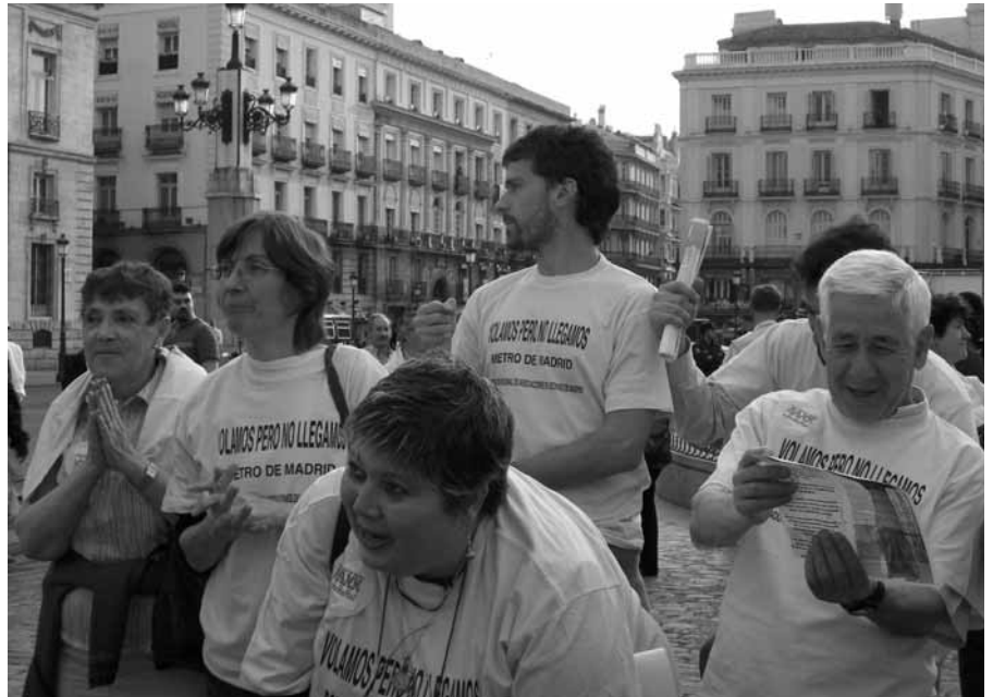
Taller impartido por la FRAVM para enseñar a los usuarios "a colocarse" en el metro.

A pesar del crecimiento económico que, durante los últimos años ha disfrutado la Comunidad de Madrid, el Gobierno regional no sólo ostenta el triste récord de ser el que menos invierte en educación, sino que la partida que más crece es la destinada a financiar la enseñanza privada concertada.