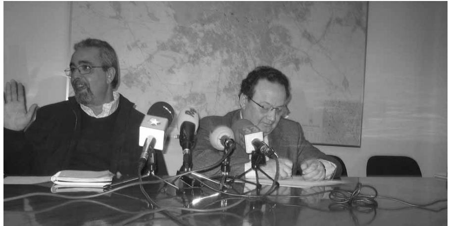
Presentación del acuerdo preelectoral firmado por el candidato de IU a la alcaldía de Madrid, Ángel Pérez.

Tras un laborioso trabajo de recopilación de las reivindicaciones vecinales, la FRAVM elaboró con las propuestas remitidas desde los barrios, distritos y municipios una suerte de mapa de necesidades que entregó a los candidatos de los tres partidos políticos tanto a la presidencia de la Comunidad de Madrid como a la alcaldía de la capital antes de la contienda electoral del pasado 27 de mayo. He aquí un somero repaso de algunas propuestas y de los compromisos adquiridos por algunas candidaturas con este movimiento.