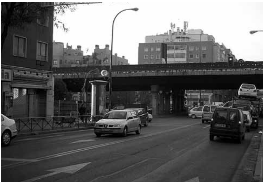
El desmantelamiento del escalet del Puente de Vallecas, una de las muchas reivindicaciones vecinales.

Candidatos de los tres partidos políticos han asumido compromisos preelectorales con el movimiento vecinal.