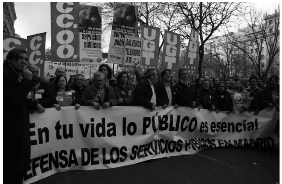
Manifestación celebrada el pasado 22 de marzo en defensa de los servicios públicos.

Y todo esto sucede a pesar de que los servicios públicos son esenciales a lo largo de toda nuestra vida. Las polí-