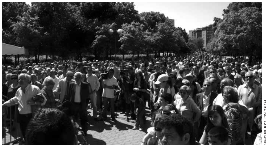
Celebración de la llegada del suburbano a Villaverde.

El lema que durante todo ese tiempo habían enarbolado las entidades vecinales, "todos ganan, nadie pierde con el metro a Villaverde", explica el sentimiento de las miles de personas que el pasado mes de abril celebraron la llega-