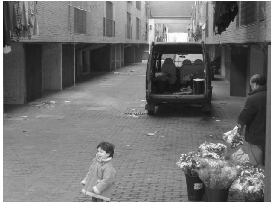
Las obras de reparación de las viviendas de Orcasur comenzarán este verano.

La A.V. Grupo Martes de Orcasur pide, además, un plan de rehabilitación integral de las calles.