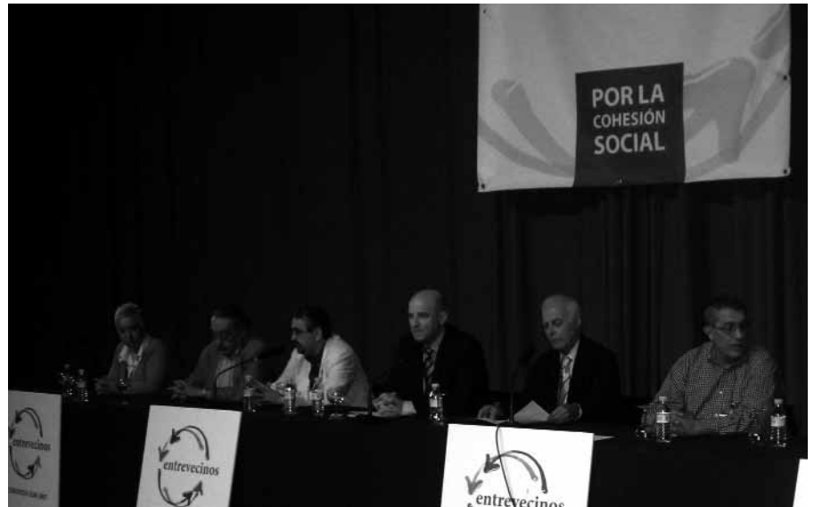
Participantes en el Congreso Entrevecinos.

Madrid acogió, los pasados 4, 5 y 6 de mayo el Congreso Entrevecinos con participación de federaciones y confederaciones vecinales de varias regiones del Estado. En ese marco alumbraron la Confederación de Asociaciones de Vecinos de España (CEAV), una organización en la que la asamblea de la FRAVM ha acordado no ingresar por el momento.