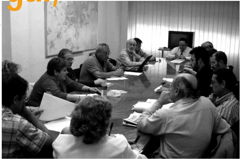
Reunión de la Junta Directiva del pasado 23 de mayo

4.- Nos afirmamos en la trayectoria histórica de la FRAVM –ratificada una y otra vez por la mayoría de las asociaciones de vecinos en todas las asambleas generales y sectoriales–, que no es otra que la presión y la negociación, la movilización de los vecinos y vecinas para conseguir desde la democratización de la política y la participación de los ciudadanos y ciudadanas en la toma de decisiones, hasta el máximo y mejor equipamiento de nuestros barrios, el reequilibrio territorial, las políticas de discriminación positiva en favor de los colectivos sociales precarizados, la vivienda protegida, los servicios públicos, la protección del medio ambiente, pasando por la rehabilitación de los cascos históricos y los poblados deteriorados, la integración social de los inmigrantes, la lucha contra el cambio climático... Consecuentemente con dicha trayectoria, en esta campaña electoral hemos seguido el procedimiento que ha