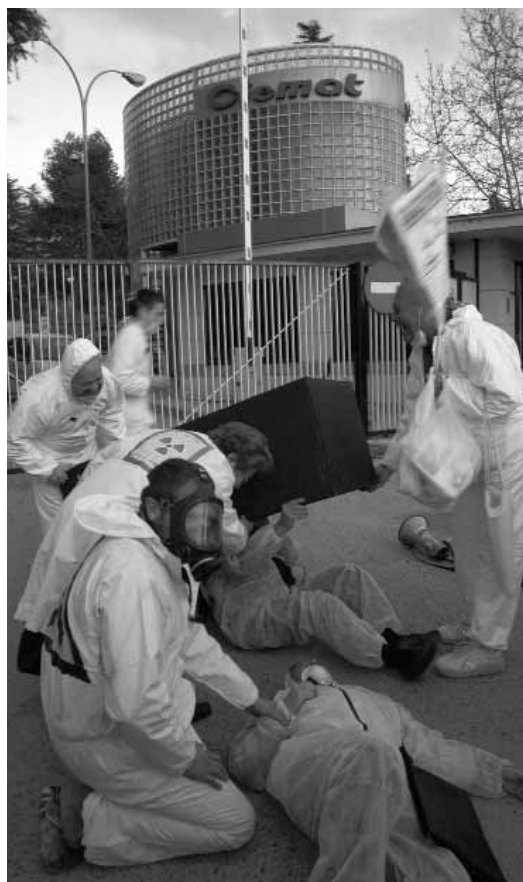
Simulacro de una situación de emergencia por contaminación nuclear en Madrid.

Tras más de tres años de infructuosas reivindicaciones, la Coordinadora decidió llevar a cabo un simulacro de emer-