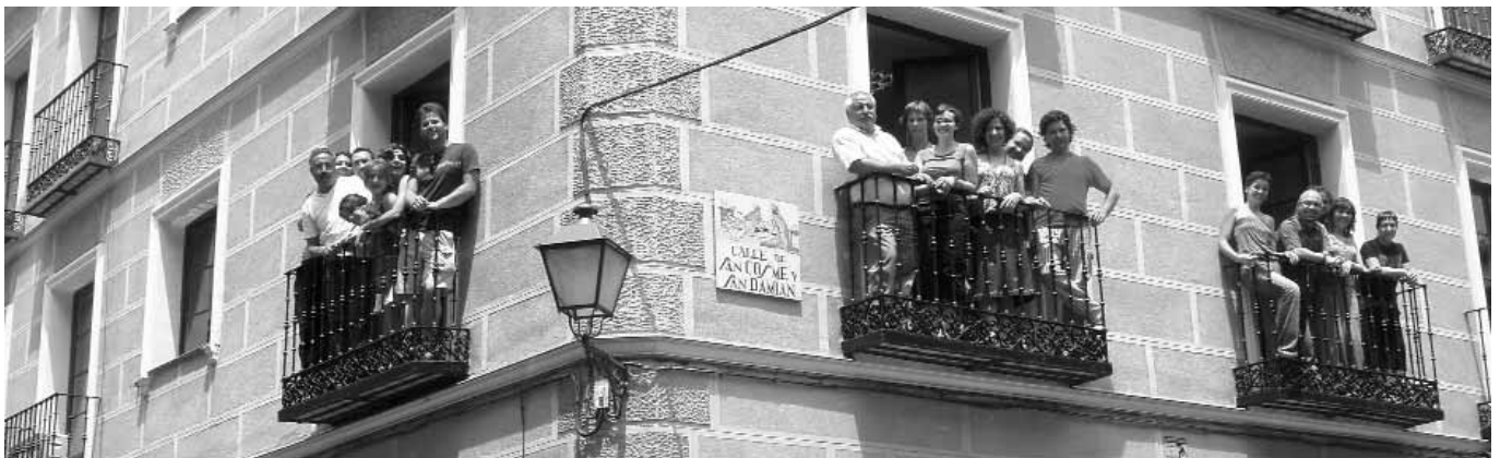
Las chicas y chicos del Servicio de Dinamización Vecinal en el local de la calle San Cosme y San Damián.

Hace ya casi tres años que el Servicio de Dinamización Vecinal (SDV) echaba a andar para hacer de la convivencia con los nuevos vecinos y vecinas un elemento vertebrador de la vida de nuestros barrios y del propio movimiento ciudadano. Por segunda vez, las chicas y chicos que trabajan en el proyecto han hecho un exhaustivo análisis de la experiencia vivida y han trazado el camino a seguir para actuar más, mejor y con más gente y llegar así más lejos en la construcción de un Madrid multicultural vertebrado y solidario.